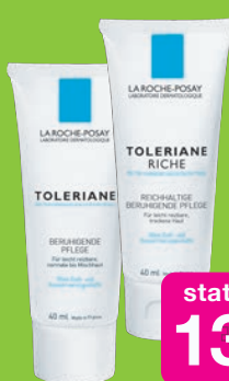
Roche Posay Toleriane normale Haut oder trockene Haut Grundpreis 42,38€ / 100ml