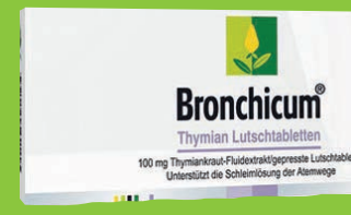
Bronchicum Thymian 50 St. Lutschtabletten