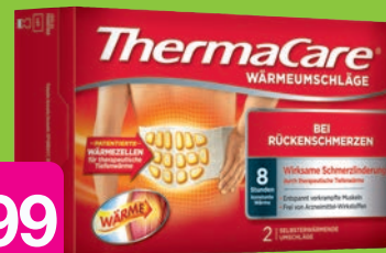
Thermacare Rückenumschläge S-XL 2 Stück