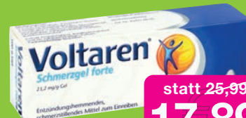
Voltaren Schmerzgel forte 150g Grundpreis 11,99€ / 100g