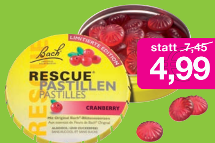
Bach Original Rescue Pastillen, Cranberry, Orange-Holunder, schwarze Johannisbeere, Zitrone 30g