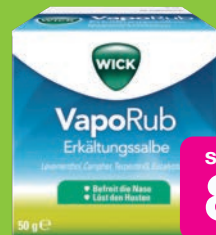
Wick Vaporub 50g Grundpreis 17,98€ / 100g