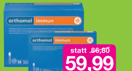
Orthomol Immun 30 Trinkfläschchen + 7 Trinkfläschchen Gratis im Wert von ca. 16,- €!