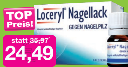
Loceryl Nagellack gegen Nagelpilz 3ml Grundpreis 1199,00€ / 100ml