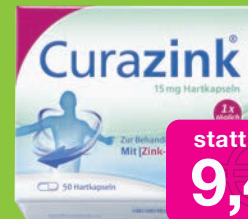
Curazink 50 St. Hartkapseln