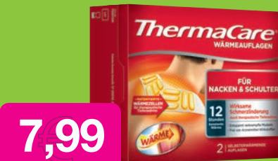
Thermacare Nacken/Schulter Auflagen 2 Stück