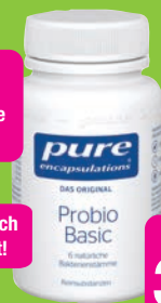
Pure – Das Original - Probio Basic 60 Kapseln