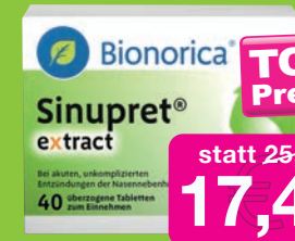
Sinupret extract 40 überzogene Tabletten