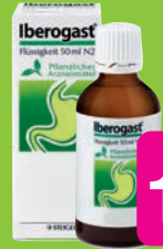
Iberogast 50ml Grundpreis 42,34€ / 100ml