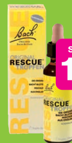
Bach Original Rescue Tropfen alkoholfrei, 20ml Grundpreis 74,95€ / 100ml