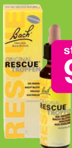
Bach Original Rescue Tropfen alkoholfrei, 10ml Grundpreis 120,00€ / 100ml