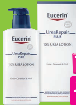
Eucerin Urea Repair 10% plus Bodylotion 400 ml Grundpreis 4,98€ / 100ml