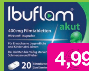
Ibuflam akut 400mg 20 St. Filmtabletten