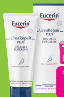
Eucerin Urea Fußcreme Grundpreis 14,70€ / 100ml