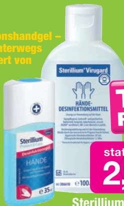
Sterillium virugard 100ml

+ Gratis Desinfektionshandgel – ideal für unterwegs 35ml im Wert von ca. 2,50 €