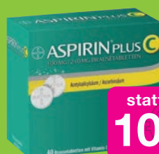
Aspirin plus C 40 St. Brausetabletten