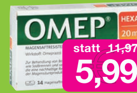
Omeprazol Hexal 14 Hartkapseln