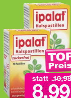
Ipalat Zuckerfrei Doppelpack 2x40 Pastillen