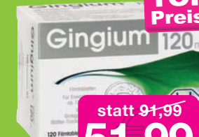
Gingium Intens Hexal 120mg, 120 St.