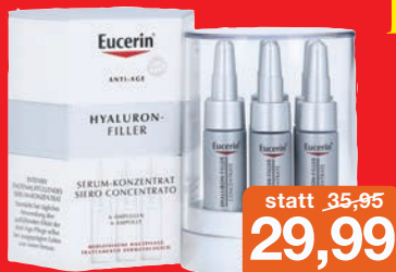
Eucerin Hyaluron Filler Serum Anti-Falten Innovation 6x5ml Konzentrat Ampullen Grundpreis 99,97€ / 100ml