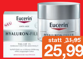
Eucerin Hyaluron Filler Tag Anti-Falten Innovation, 50ml Grundpreis 51,98€ / 100ml