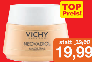
Vichy Neovadiol Magistral 50ml Intensiv 24 h Aufbaupflege für trockene Haut Grundpreis 39,98€ / 100ml