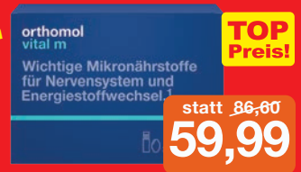
Orthomol Vital M 30+7 Trinkflaschen

+ 7 Trinkflaschen Gratis im Wert von 20,50 €