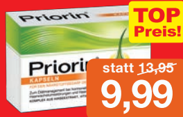
Priorin für volles, dichtes Haar 30 Kapseln