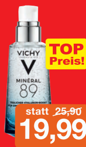
Vichy Mineral 89 Hyaluron Booster Serum für frische, verjüngte Haut, 50 ml Grundpreis 39,98 € / 100ml