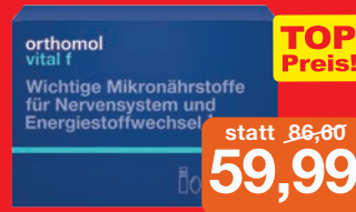
Orthomol Vital F 30+7 Trinkflaschen

+ 7 Trinkflaschen Gratis im Wert von 20,50 €