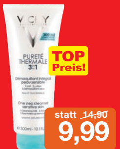
Vichy 3 in 1 Reinigungsmilch 300ml Grundpreis 3,33 € / 100ml