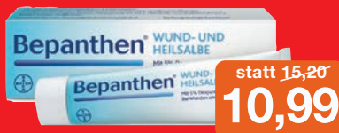
Bepanthen Wund- und Heilsalbe 100g