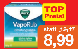
Wick Vaporub 50g Salbe Grundpreis 17,98€ / 100g