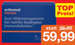
Orthomol Immun 30+7 Trinkflaschen

+ 7 Trinkflaschen Gratis im Wert von 20,50 €