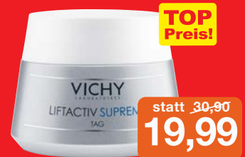
Vichy Liftactiv Supreme NH 50ml Intensiv 24 h Aufbaupflege für normale Haut Grundpreis 39,98€ / 100ml