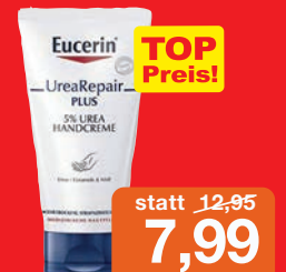
Eucerin Urea Repair Plus Handcreme 5% 75ml Grundpreis 10,65 € / 100ml